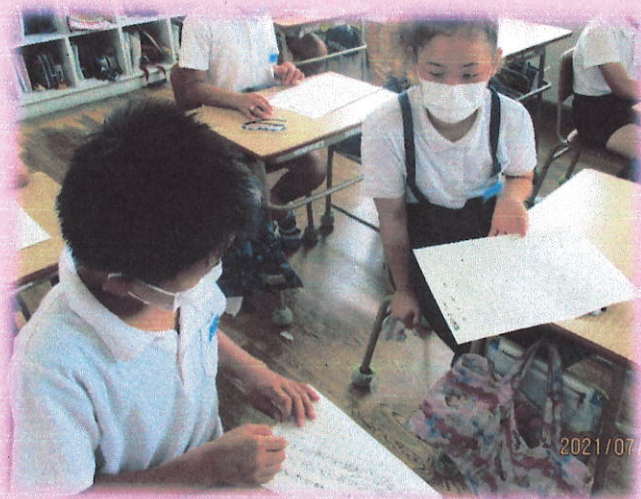
【書いたことをお互い見合う姿】

※「学校だより」についてのご意見・ご感想がありましたら、学校までよろしくお願いします。