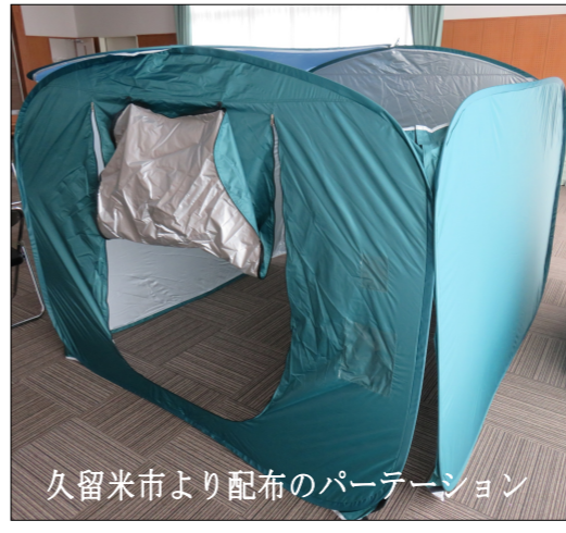
久留米市より配布のパーティション

久留米市が避難所用 パーティション配布 今年の7月は豪雨が続き、9 月には台風8号、9号、10号と 3つの台風が接近しました。毎 年各地で自然災害による被害が 出ています。 今回、避難所のパーティショ ンに使うパーティションが、市の防災対 策課より配布されました。2m ×2mの大きさをワンタッチで 簡単に広げることが出来ます。 避難所でのプライバシーを守る ために必要なもので、市は今後 もパーティションの数を増やしていく計 画です。 災害はいつ起きるかわかりま せん。これからは自然災害に備 えた意識を持ち続けたいと思ひ ます。